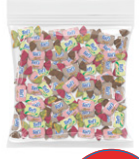
TAFI LOS COQUEIROS CAMELO MASTICABLE SABOR SURTIDO