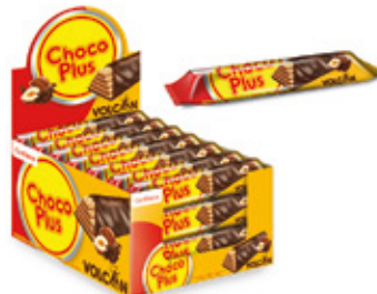
CHOCOPLUS VOLCAN SABOR CREMA AVELLANA

88430 6 Unid. Paca 24 Unid. Display 1800 (g) Peso Display