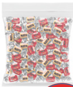
AMERICAN BUTTER TOFFEES CAMELO SABOR SURTIDO

002842 2 Unid. Paca 5 Kg Peso Fundón 002844 4 Unid. Paca 2.5 Kg Peso Fundón