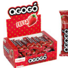
AGOGO FRESA CHICLE SABOR FRESA AGOGO x5

003507 30 Unid. Paca 24 Unid. Display 276 (g) Peso Display