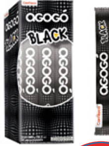
AGOGO BLACK CHICLE SABOR FRUTAS CITRICAS AGOGO x10

003313 40 Unid. Paca 15 Unid. Display 345 (g) Peso Display