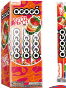
AGOGO TUTTI FRUTI CHICLE SABOR TUTTI FRUTI AGOGO x10

002299 40 Unid. Paca 15 Unid. Display 345 (g) Peso Display