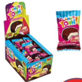
MINI PAYE GALLETAS CON MARSHMALLOW CUBIERTA DE CHOCOLATE

88433 6 Unid. Paca 24 Unid. Display 600 (g) Peso Display