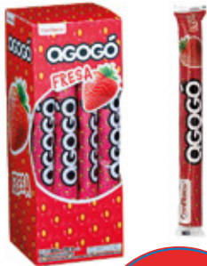
AGOGO FRESA CHICLE SABOR FRESA AGOGO x10

003639 40 Unid. Paca 15 Unid. Display 345 (g) Peso Display