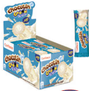
CHOCOTIN CAÑON SABOR RELLENO BLANCO

99700 8 Unid. Paca 24 Unid. Display 552 (g) Peso Display