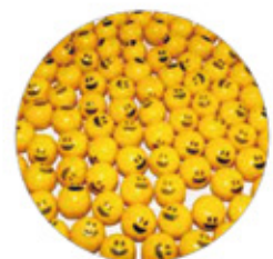
AGOGO CARITA FELIZ CHICLE BOLA GIGANTE SABOR TUTTI FRUTI