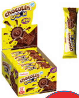
CHOCOTIN CAÑON SABOR RELLENO CHOCOLATE

99700 8 Unid. Paca 24 Unid. Display 552 (g) Peso Display