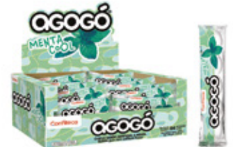
AGOGO MENTA COOL CHICLE SABOR MENTA AGOGO x5

002859 30 Unid. Paca 24 Unid. Display 276 (g) Peso Display