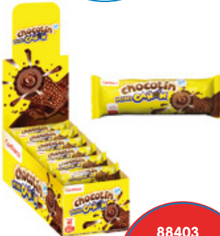
CHOCOTIN MINI CAÑON SABOR CREMA AVELLANA

99689 8 Unid. Paca 24 Unid. Display 552 (g) Peso Display