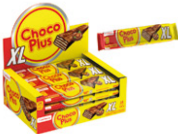
CHOCOPLUS XL SABOR CREMA AVELLANA

88418 6 Unid. Paca 24 Unid. Display 1320 (g) Peso Display