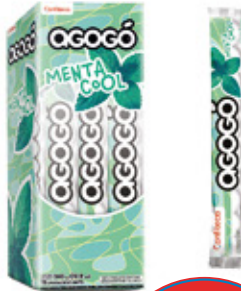
AGOGO MENTA COOL CHICLE SABOR MENTA AGOGO x10

002703 40 Unid. Paca 15 Unid. Display 345 (g) Peso Display