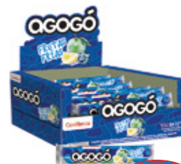
AGOGO FRUTAS FRIAS CHICLE SABOR BLUEBERRY, MANZANA, LIMON AGOGO x5

001995 30 Unid. Paca 24 Unid. Display 276 (g) Peso Display