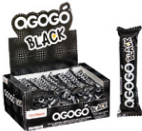
AGOGO BLACK CHICLE SABOR FRUTAS CITRICAS AGOGO x5

003312 30 Unid. Paca 24 Unid. Display 276 (g) Peso Display