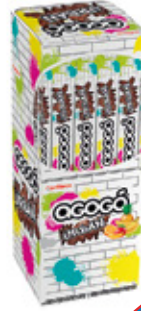
AGOGO URBAN CHICLE SABOR FRUTOS TROPICALES AGOGO x10

002970 40 Unid. Paca 15 Unid. Display 345 (g) Peso Display