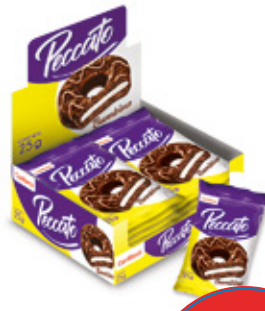
PECCATO BAMBINO SABOR CHOCOLATE

88422 6 Unid. Paca 24 Unid. Display 1344 (g) Peso Display