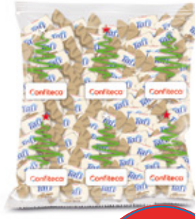
TAFI LOS COQUEIROS CAMELO MASTICABLE SABOR COCO