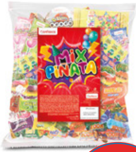
MIX PIÑATA SABOR SURTIDO