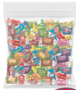
CAMELO SAQUITO CAMELO SABOR SURTIDO

00212 1 Unid. Paca 10 Kg Peso Fundón 00468 4 Unid. Paca 2.5 Kg Peso Fundón