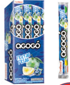
AGOGO FRUTAS FRIAS CHICLE SABOR BLUEBERRY, MANZANA, LIMON AGOGO x10

003508 40 Unid. Paca 15 Unid. Display 345 (g) Peso Display