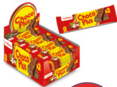
CHOCOPLUS DUO SABOR CREMA AVELLANA

88403 6 Unid. Paca 24 Unid. Display 1320 (g) Peso Display