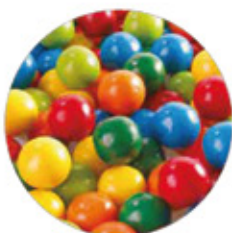
AGOGO ORIGINAL CHICLE BOLA SABOR TUTTI FRUTI

000124 Supergigante 8 Fundas de 2 kg - paca 00098 Gigante 4 Fundas de 4 kg - paca 0009 Pequeña 8 Fundas de 1.725 kg - paca