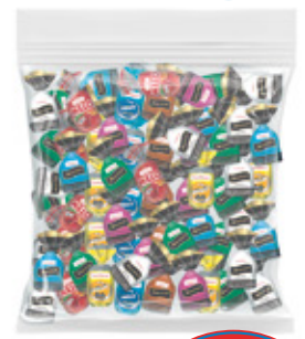
CAMELO SAQUITO CAMELO SABOR SURTIDO

00212 1 Unid. Paca 10 Kg Peso Fundón 00468 4 Unid. Paca 2.5 Kg Peso Fundón