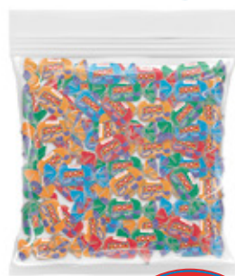
ZOOM CAMELO MASTICABLE SABOR SURTIDO