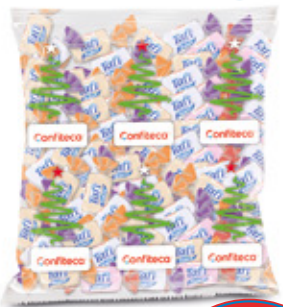
TAFI YOGURT CAMELO MASTICABLE SABOR SURTIDO