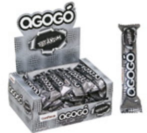
AGOGO TITANIUM CHICLE SABOR MENTA TITANIUM AGOGO x5

002285 40 Unid. Paca 15 Unid. Display 345 (g) Peso Display