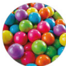
AGOGO ARCO IRIS CHICLE BOLA GIGANTE SABOR TUTTI FRUTI

000124 Supergigante 8 Fundas de 2 kg - paca 00098 Gigante 4 Fundas de 4 kg - paca 0009 Pequeña 8 Fundas de 1.725 kg - paca