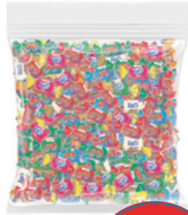
TAFI SURTIDO CAMELO MASTICABLE SABOR SURTIDO