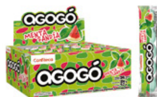
AGOGO MENTA SANDIA CHICLE SABOR MENTA SANDIA AGOGO x5

001936 30 Unid. Paca 24 Unid. Display 276 (g) Peso Display