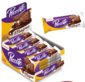
PECCATO MAGNO SABOR CHOCOLATE

88384 12 Unid. Paca 48 Unid. Display 576 (g) Peso Display