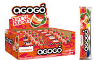
AGOGO TUTTI FRUTI CHICLE SABOR TUTTI FRUTI AGOGO x5

003638 30 Unid. Paca 24 Unid. Display 276 (g) Peso Display