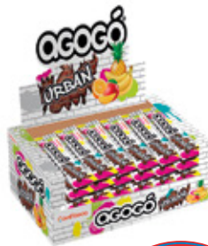
AGOGO URBAN CHICLE SABOR FRUTOS TROPICALES AGOGO x5

003323 30 Unid. Paca 24 Unid. Display 276 (g) Peso Display