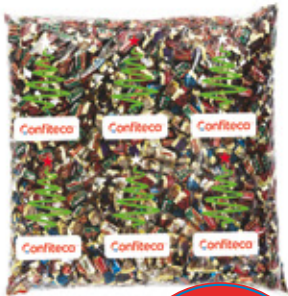
AMERICAN TOFFEE CAMELO SABOR SURTIDO

002905 2 Unid. Paca 5 Kg Peso Fundón 00470 4 Unid. Paca 2.5 Kg Peso Fundón