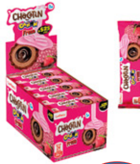
CHOCOTIN CAÑON SABOR RELLENO FRESA

99699 8 Unid. Paca 24 Unid. Display 552 (g) Peso Display