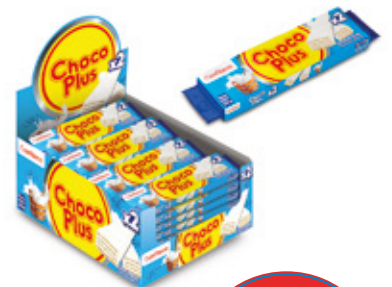
CHOCOPLUS DUO BLANCO

88403 6 Unid. Paca 24 Unid. Display 1320 (g) Peso Display