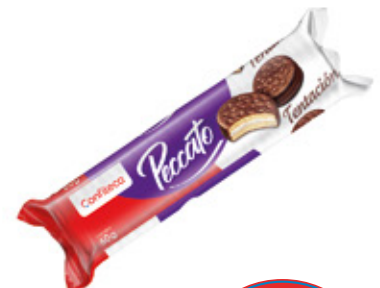
PECCATO BAMBINO SABOR CHOCOLATE

88423 6 Unid. Paca 24 Unid. Display 600 (g) Peso Display