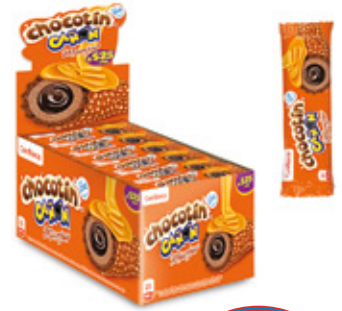
CHOCOTIN CAÑON SABOR RELLENO MANJAR

-- 8 Unid. Paca 24 Unid. Display 552 (g) Peso Display