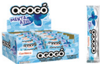
AGOGO MENTA AZUL CHICLE SABOR MENTA AGOGO x5

001917 30 Unid. Paca 24 Unid. Display 276 (g) Peso Display