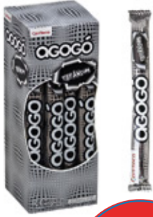
AGOGO TITANIUM CHICLE SABOR MENTA TITANIUM AGOGO x10

003313 40 Unid. Paca 15 Unid. Display 345 (g) Peso Display