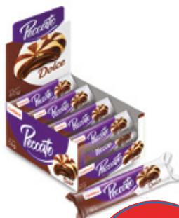
PECCATO DOLCE SABOR CHOCOLATE

88421 6 Unid. Paca 24 Unid. Display 1440 (g) Peso Display